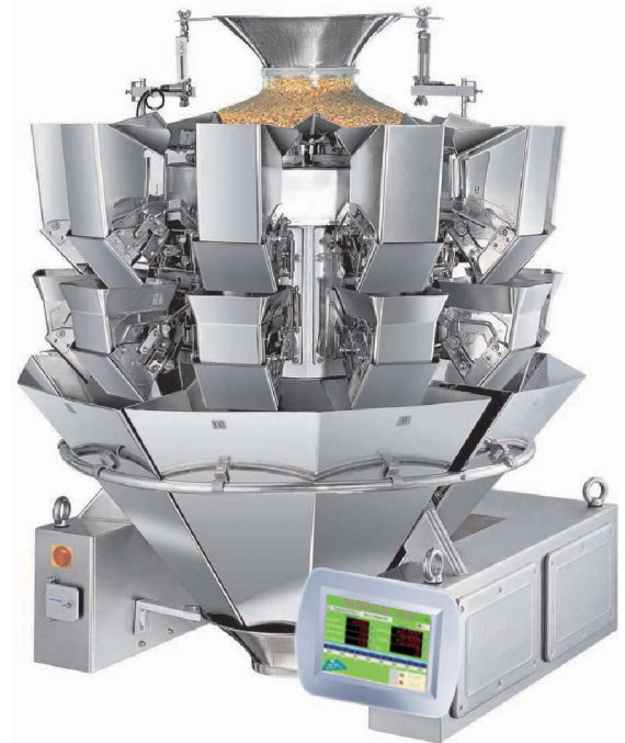
DW-MH/C10/25 Pesadora Multicabezal Circular de 10 básculas y 2.5 l de capacidad